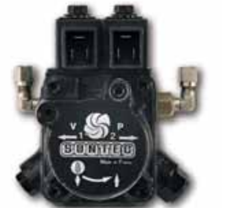
▲ Yakıt pompası