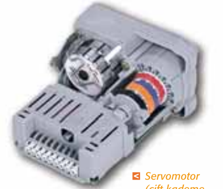
▲ Servomotor (çift kademe brülörlerde)