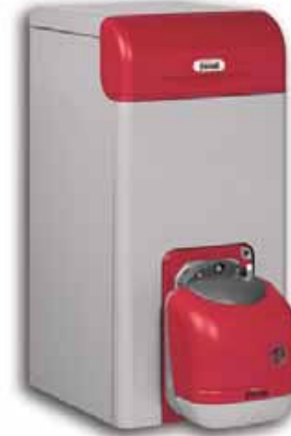
▲ G6 R kazan ve SUN 6 brülör uygulaması