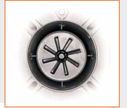
▲ Yanma kafası